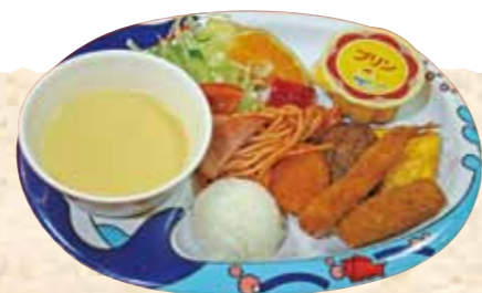
お子様ランチ (スープ付)