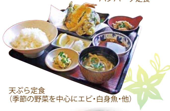
天ぷら定食 (季節の野菜を中心にエビ・白身魚・他)