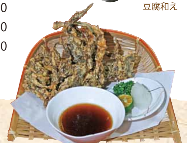
やんばる天ぷら (アーサ・モズク)