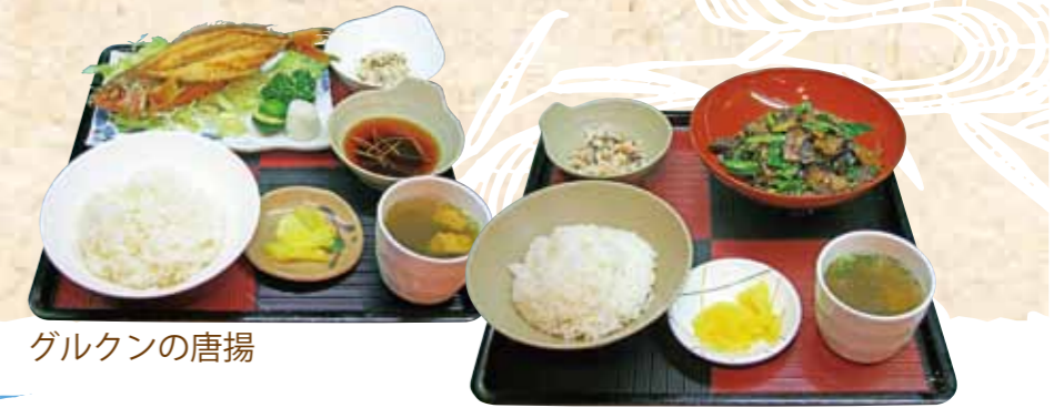
ヒートウのニンニク炒め