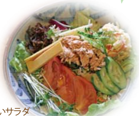
ぬちぐすいサラダ (具だくさんのヘルシーサラダ)