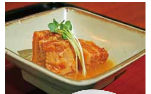
ラフティー (豚の角煮)