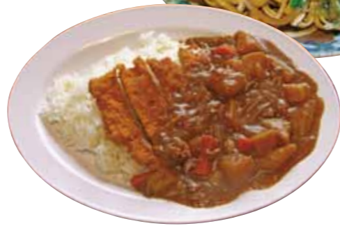
カツカレーライス